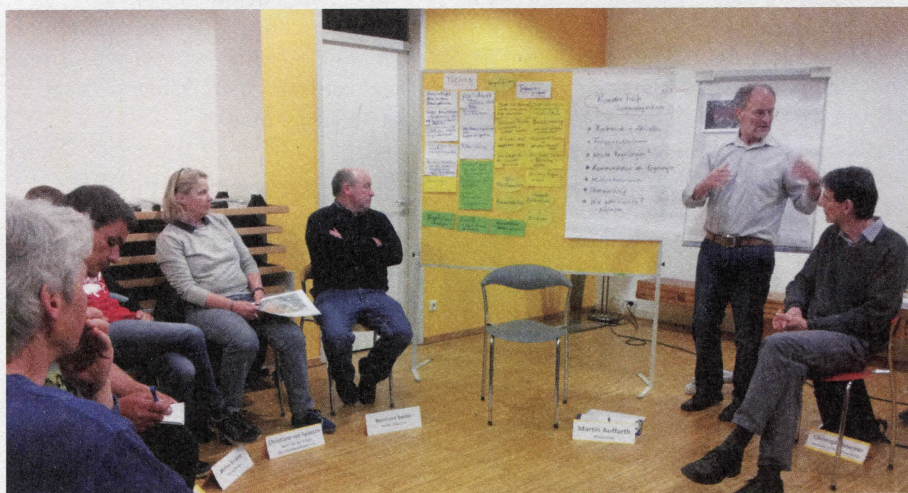
Der 3. Runde Tisch zu Nutzungskonflikten am Schönberg am 31.03.17